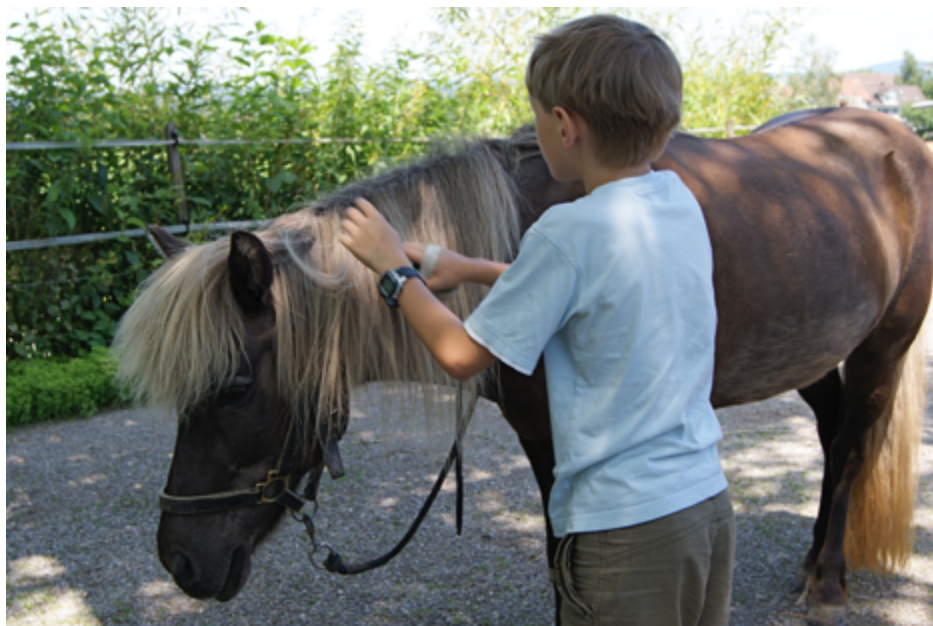
Assas Mähne wird gebürstet.